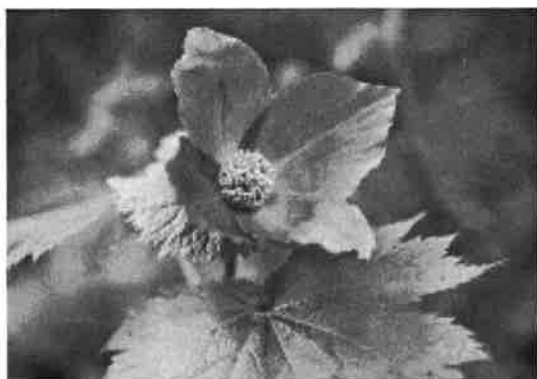
妙高市の花 「シラネアオイ」